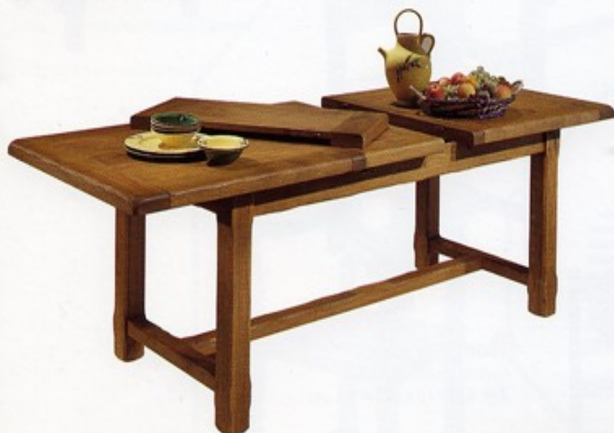
Table de Ferme

Réf. TE 300 (3 pieds): 300x30. Ht 47 cm.